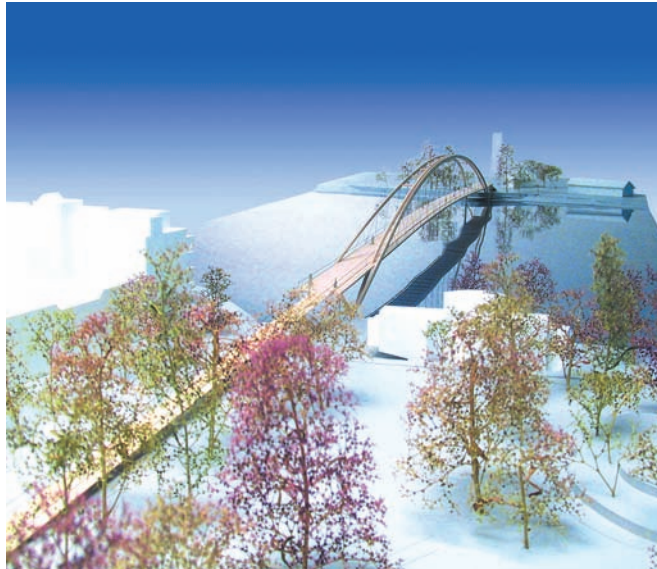
Modell; asymmetrische Querschnittsform © Feichtinger Architectes

Zur Aufnahme der horizontalen Kräfte aus dem Bogenschub wird das Brückendeck auf beiden Seiten um 10 m nach hinten verlängert und mit dem Bogen kurzgeschlossen. Die Ableitung der Kräfte erfolgt über vertikale Zugpendel ins Erdreich. Der Bogenhochpunkt liegt ca. 14 m über dem Brückendeck bzw. 20 m über den Bogenfußpunkten. Der nördliche Bogen steht senkrecht, der südliche lehnt sich mit einer Neigung von 18° an. Die Querschnittsabmessungen sind sehr unterschiedlich und wurden so gewählt, daß sich die Bögen unter Eigengewicht nach Norden, unter Verkehrslasten nach Süden neigen. Aus der asymmetrischen Anordnung ergibt sich somit ein ausgewogenes System. Der architektonische Anspruch einer »starken« und einer »schwachen« Seite wurde damit auch im Tragwerk sinnvoll umgesetzt.