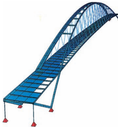
Idealisiertes Tragwerk © Leonhardt, Andrä und Partner

Brückendeck: Die Konstruktion des Brückendecks ist ebenfalls asymmetrisch. Der nördliche Hauptträger hat einen sechseckigen Querschnitt mit h/b = 1.000 \text{ mm}/700 \text{ mm} , der südliche Randträger ist ein Rohr mit 250 mm Durchmesser.