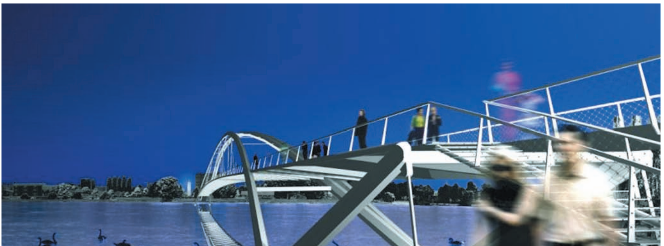
Brückendeck; Uferbereich © Feichtinger Architectes

Leonhardt, Andrä und Partner Beratende Ingenieure VBI, GmbH Büro Berlin