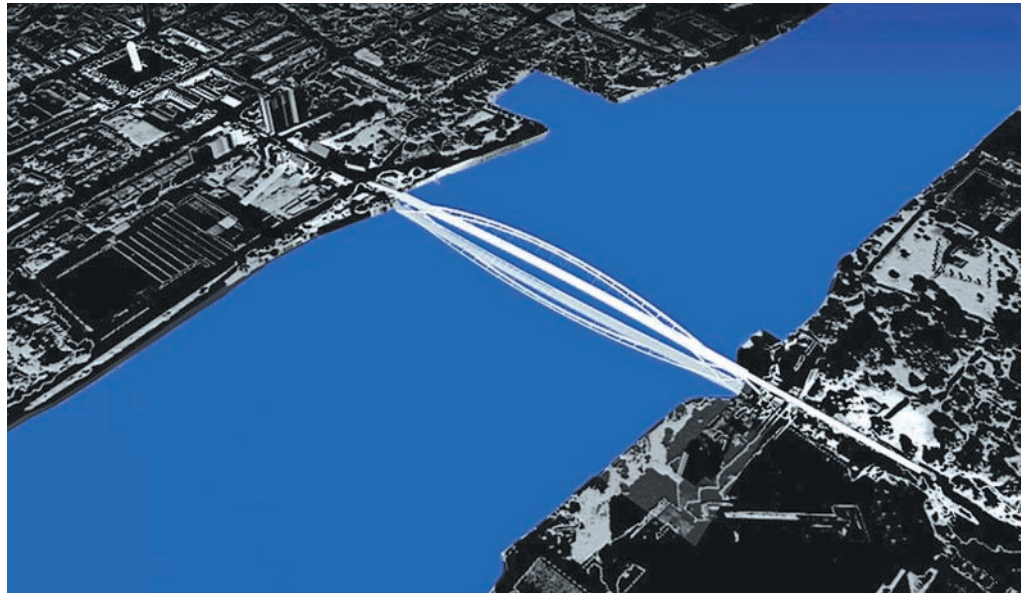
Lage; links Huningue, rechts Weil am Rhein © Feichtinger Architectes