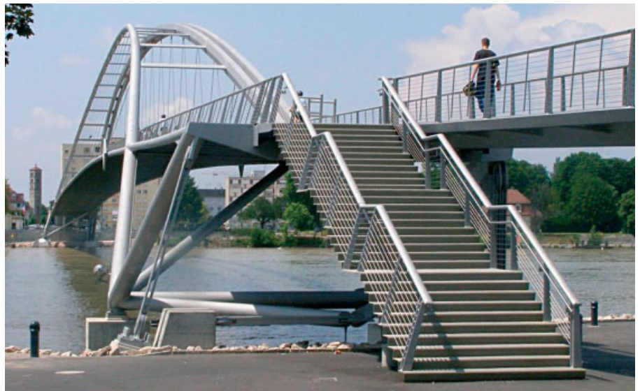
Ein flacher Bogen überspannt den Rhein

Mittlerweile ist die Brücke ein touristischer Anziehungspunkt der gesamten Region. Sie erhält für ihre klare Form und die gut entwickelten Details eine „Auszeichnung“ zum Ingenieurbau-Preis.