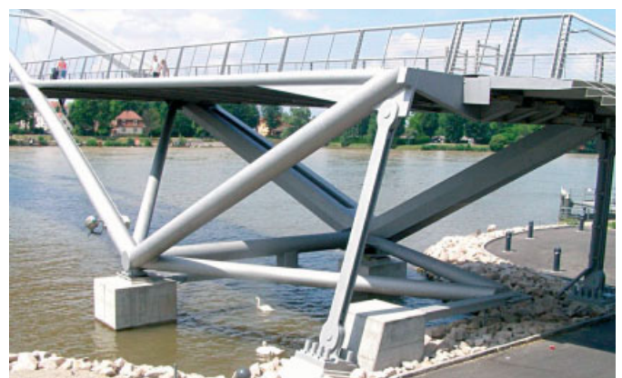
Bogenfußpunkte an den Ufern, um die Schifffahrtsöffnung freizuhalten