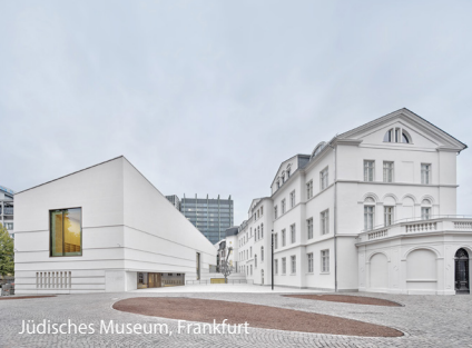
Jüdisches Museum, Frankfurt