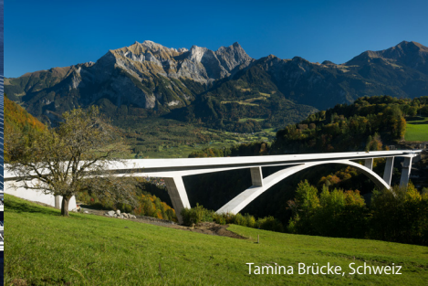
Tamina Brücke, Schweiz